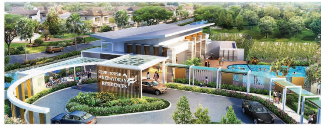
Bird Eye View Clubhouse Kebayoran Residences