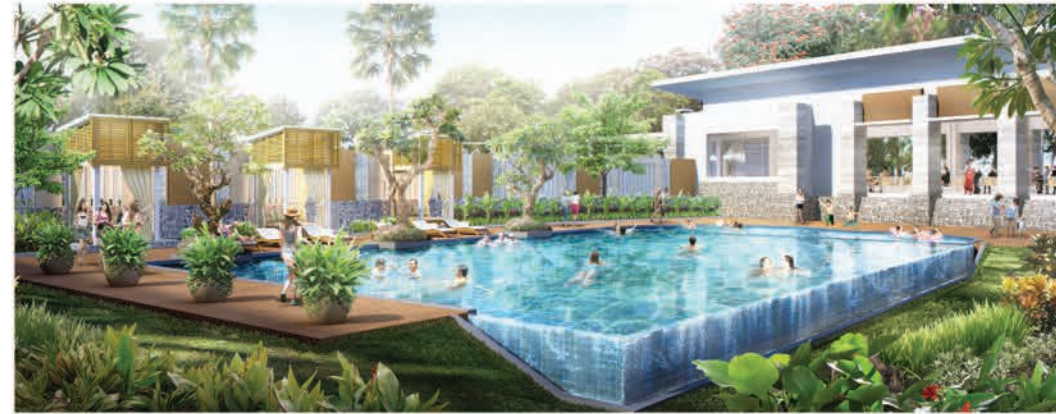
Clubhouse Kebayoran Residences