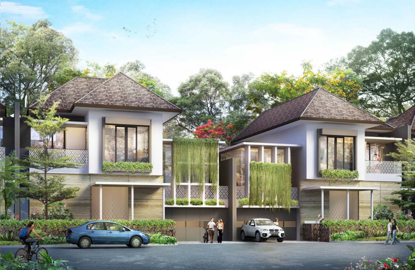
TIPE SONATA 312/255