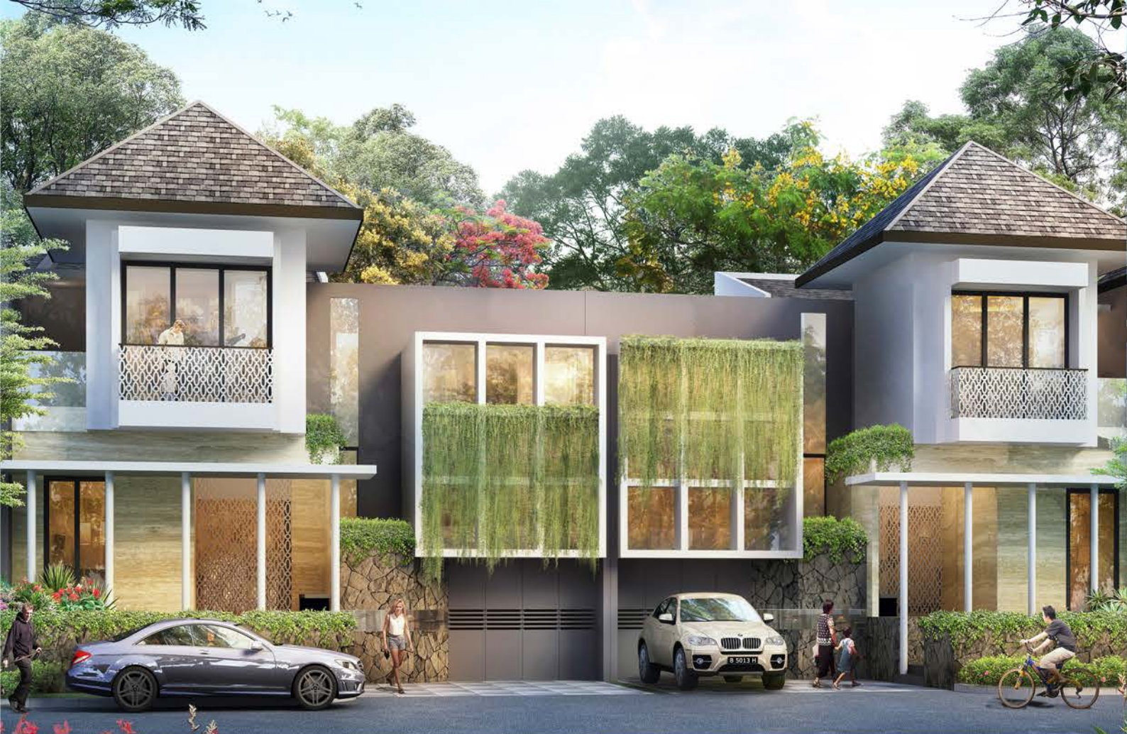
TIPE ALLEGRA 240/204